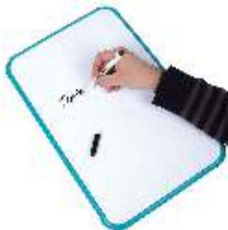
PIZARRA ACRÍLICA 20X30CMS